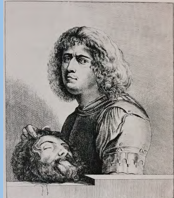
VERO RITRATTO DE GIORGONE DE CASTEL FRANCO da luy fatto come lo celebra il libro del VASARI.

GIORGIONE DA CASTEL FRANCO PITTORE VINITIANO.