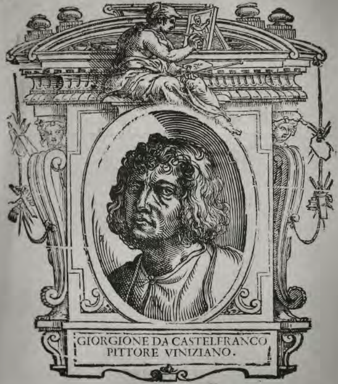
GIORGIONE DA CASTELFRANCO PITTORE VINIZIANO.

GIORGIONE DA CASTEL FRANCO PITTORE VINITIANO.