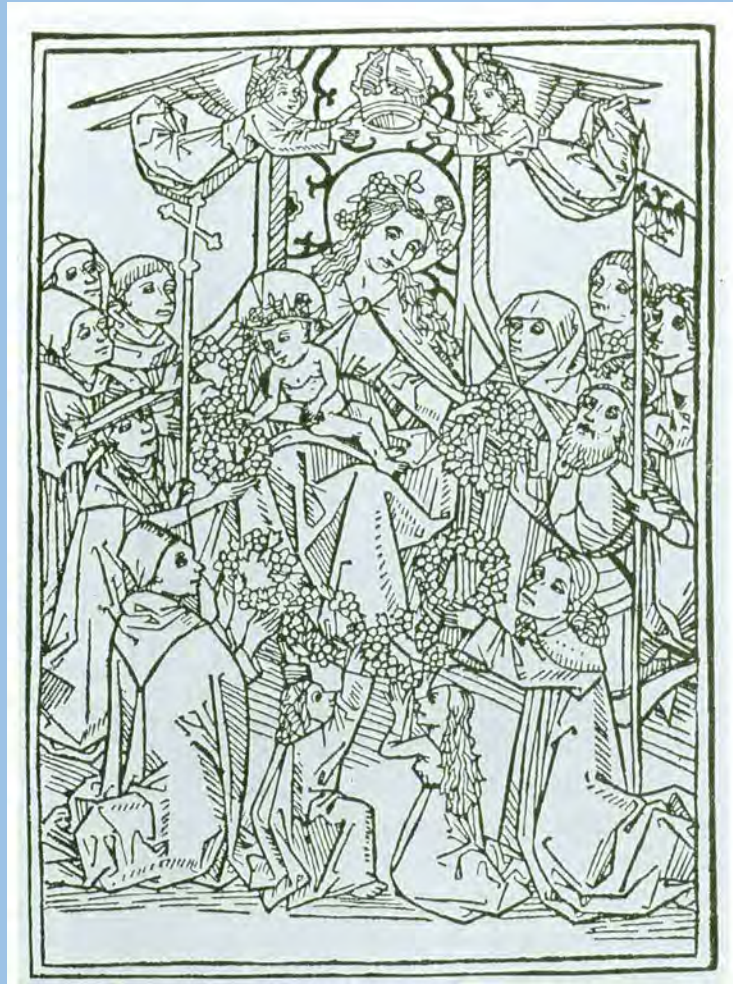
75. Holzschnitt aus Jakob Sprengers Rosenkranzschrift. Augsburg 1476