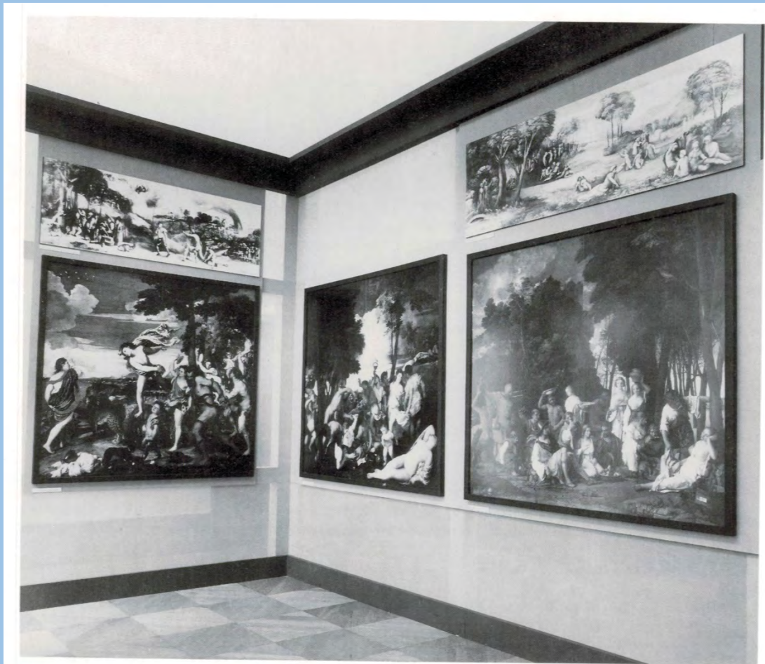
The Camerino d'Alabastro, reconstruction, Nationalmuseum