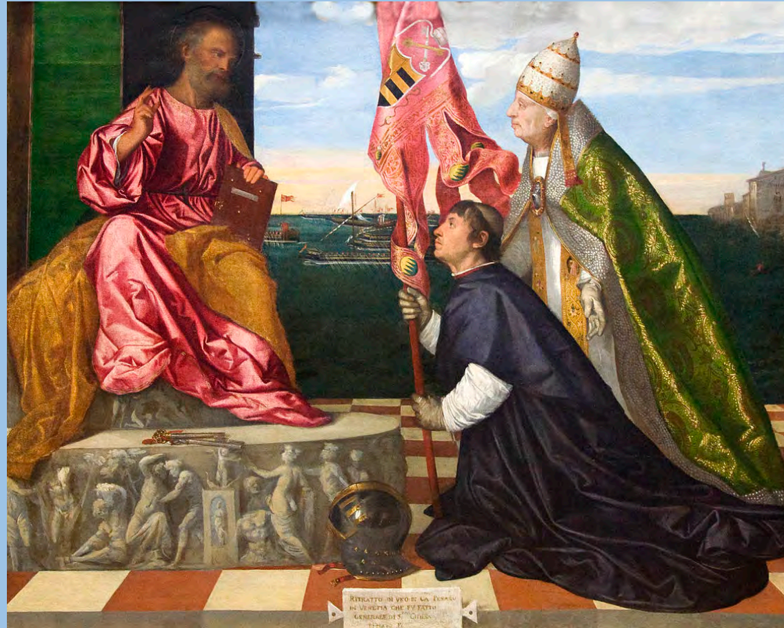
RETRATTO DI VIO DI CA' FERRARI DI VENEZIA CHE FU FATTO GENERALE DI S. CROCE 1519