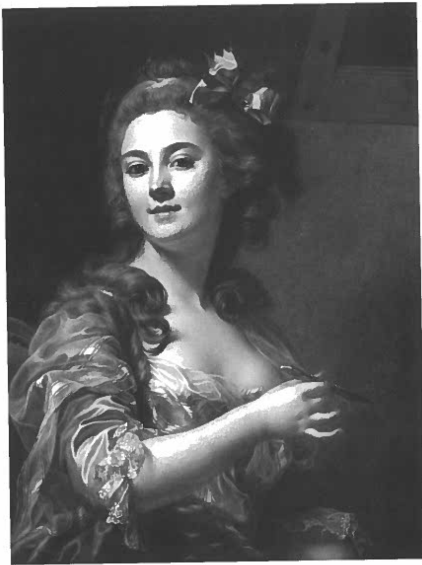
Abb. 8 Marie-Gabrielle Capet, Selbstbildnis mit Zeichenstift, ca. 1783. Öl/Lw., 77,5 x 59,5 cm. Tokyo, The National Museum of Western Art (Kuhn 2020, Taf. 21)

vorne, wie die Malerin an der Staffelei sitzend, ist Marie-Gabrielle Capet mit einer farbbesetzten Palette auf ihrem Schoß und einem Palettmesser in der rechten Hand dargestellt. Sie als Einzige schaut direkt aus dem Bild, um uns zu adressieren. So sind vier Generationen von Malern in direkter Abfolge versammelt.