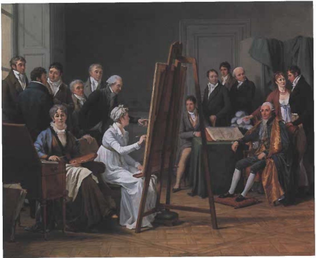
Abb. 6 Marie-Gabrielle Capet, Selbstporträt unter MalerInnen (Atelierszene), 1808. Öl/Lw., 69 x 83,5 cm. München, Bayerische Staatsgemäldesammlungen (Kuhn 2020, Taf. 19)

wurde in drei Büchern veröffentlicht unter dem bezeichnenden Titel The Memoirs of a Dramatist, Theatrical Manager, Painter, Critic, Novelist, and Historian . Maler war er also nur unter anderem. Zudem wird man festhalten müssen, dass seine Auffassung von der Eigenständigkeit der amerikanischen Kunst in einem erstaunlichen Missverhältnis zu seiner Selbsteinschätzung als Künstler steht. Wobei es ein Paradoxon darstellt, dass sich seine passagenweise geradezu vernichtende Selbstcharakterisierung, der Hinweis auf seine mangelnde Begabung und vor allem seine unzureichende künstlerische Entwicklung als Vita in seiner History der amerikanischen Kunst finden und zwar, was das Paradoxon noch steigert, in einem Umfang, wie ihn keine andere Vita in seinem Werk aufweist.