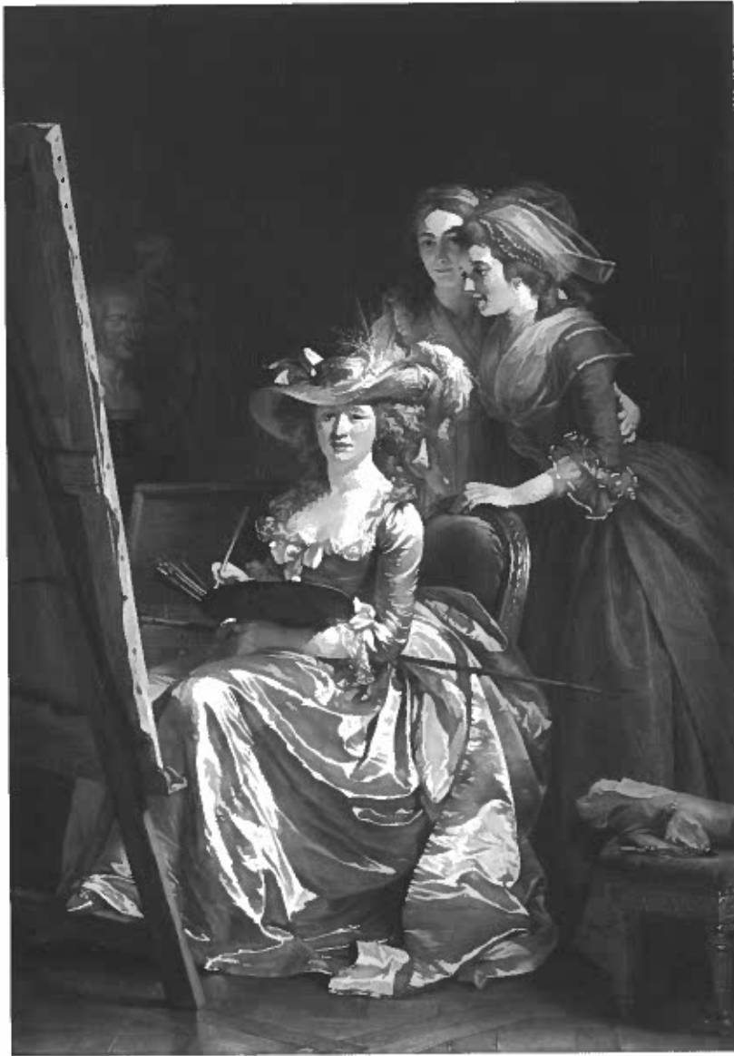
Abb. 7 Adélaïde Labille-Guiard, Selbstporträt mit zwei Schülerinnen (Marie-Gabrielle Capet und Marie Marguerite Carreaux de Rosemond), 1785. Öl/Lw., 210,0 x 151,1 cm. New York, Metropolitan Museum of Art ( https://images.metmuseum.org/CRDImages/np/original/DP320103.jpg )

Schauspielers Colley Cibber bei Abfassung seiner Memoiren (Abb. 5). Auch hier greift die Tochter von hinten an die Feder, will mit-schreiben und weist mit dem Zeigefinger der Linken aufmerk-sam nach oben.