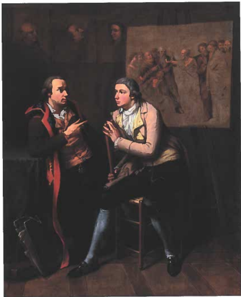
Abb. 1 Johann Heinrich Wilhelm Tischbein, Einer den andern gemahlt , 1782. Öl/Lw., 81 x 65,3 cm. Frankfurt a. M., Freies Deutsches Hochstift, Goethe-Museum [Kuhn 2020, Taf. 1]

cher kaum sein könnten. Die Bilder, so die Kernthese des Buches, schreiben ihre Geschichte selbst.