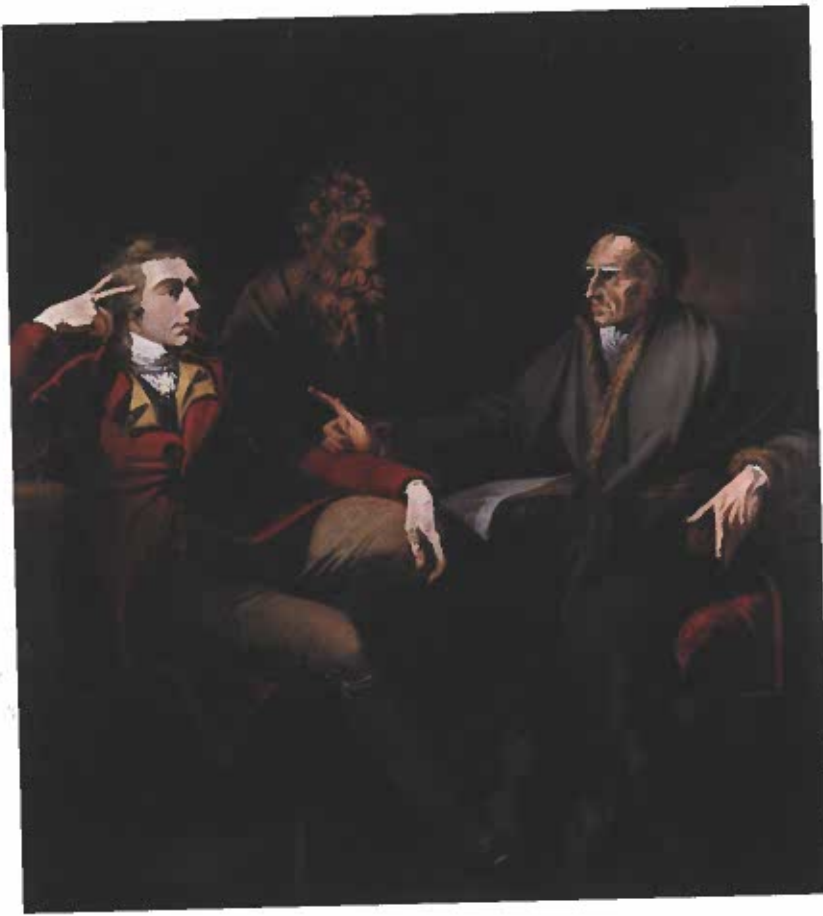
Abb. 2 Johann Heinrich Füssli, Selbstbildnis im Gespräch mit Johann Jakob Bodmer, 1780. Öl/Lw., 163 x 150 cm. Zürich, Kunsthaus (Kuhn 2020, Taf. 5)

tet, Dunlaps Gemälde verdankt sich den besonderen Umständen amerikanischer Kunstentwicklung und Capets Bild schließlich hat sich im dichten Netz der Pariser Kunstöffentlichkeit von Akademie, Salon und Kritik zu behaupten.