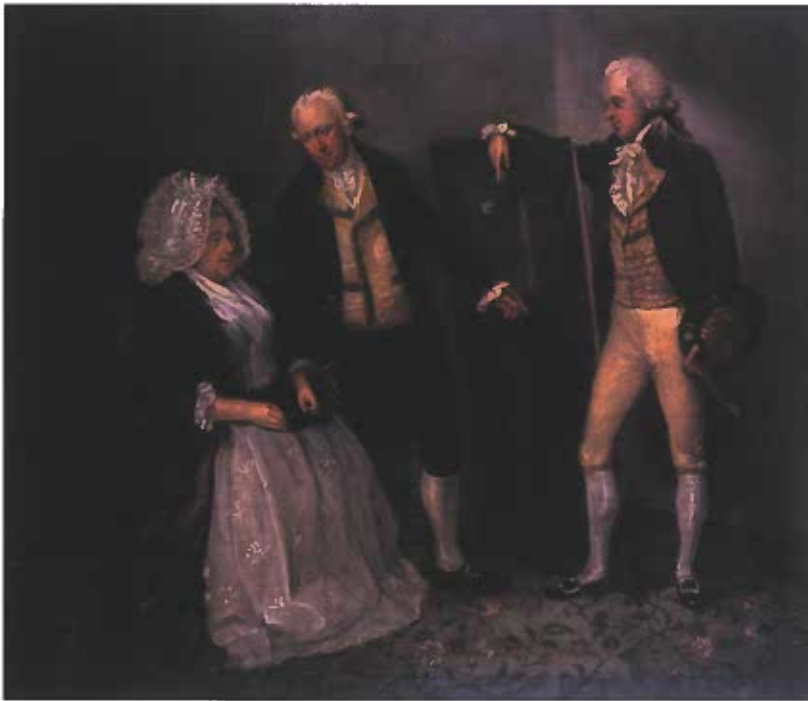
Abb. 3 William Dunlap, Selbstporträt mit Shakespeare-Gemälde und Eltern (The Dunlap Family), 1788. Öl/Lw., 107,3 x 124,5 cm. New York, The New-York Historical Society [Kuhn 2020, Taf. 9]

Tischbeins „Herkules am Scheideweg“ von 1780 wird hier begriffen als Vorbereitung und Demonstration für die Wahl eines nun eingeschlagenen Weges. Das folgt durchaus einem Typus mit Tradition, Reynolds und Koch werden angeführt: Das Herkules-Thema kann für Kunstalternativen eintreten, bei Reynolds ist damit die Wahl zwischen zwei künstlerischen Modi markiert. Und wie Reynolds versucht Tischbein, die Gattung Porträt zu nobilitieren und am Rang der Historie teilhaben zu lassen. Der Bruch mit der Tradition mag auch durch das Diogenes-Thema anklingen: statt Konvention Wahrheitssuche. Merck und Goethe haben dies begriffen und sahen den Anspruch in Tischbeins Bild eingelöst.