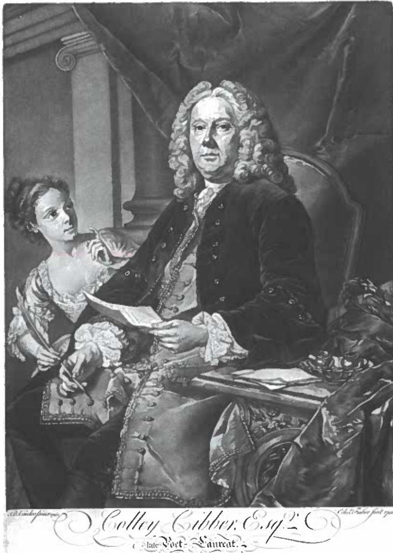
Abb. 5 Edward Fisher, Colley Cibber, Esq., late Poet Laureate, 1758. Kupferstich nach einem Gemälde von Jean-Baptiste van Loo (1740). Royal Collection Trust, RCIN 652561 ( https://www.rct.uk/sites/default/files/collection-online/0/3/413894-1378899471.jpg )

Malen seiner Frau Rachel zeigt, offenbar als Memorialbild der 1790 Gestorbenen gedacht (Abb. 4). Hinter dem Maler jedoch taucht seine Tochter Angelica Kauffmann auf, ergreift an seiner Schulter vorbeiliegend den Malpinsel des Vaters, erhebt dabei den Zeigefinger der Linken und blickt auf den Betrachter. Der Name der Tochter sollte nicht verwundern, die unendliche Kinderschar von Peale wurde durch die Bank mit Künstlernamen versehen, es gibt die Söhne Rembrandt, Raphael und Tizian. Offenbar geht es Peale um die Begründung einer amerikanischen Künstlerdynastie mit lauter neuen „Raphaels“. Zur motivischen Herkunft des Porträts mit Gattin und Tochter gibt es nun allerdings Wichtiges zu ergänzen. Denn die Tochter mit ihrem erhobenen Zeigefinger verweist nicht etwa, wie vermutet, auf göttliche Inspiration, auch weniger auf den Wohnort der Mutter im Himmel, vielmehr ist das komplexe Motiv mit der sich heranschleichenden Tochter, die den Pinsel mitführen will, eine intelligente Paraphrase auf zwei auch im Stich verbreitete Gemälde. In erster Linie auf Jean-Baptiste van Loos in England ausgeführtes Porträt des berühmten