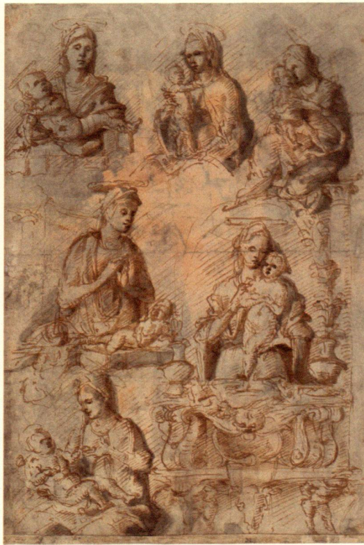
Abb. 1 Marco Zoppo, »Blatt mit Marientypen« (recto und verso), München, Staatliche Graphische Sammlung

seiner Werkstatt, die im weitesten Sinne als Variationen danach verstanden werden können. Ein Vorzug von Mantegnas Andachtsbildern in den Augen zeitgenössischer Kunstkenner dürfte also gewesen sein, dass sie damit eine exklusive Kompositions-idee erwarben. 15 Wobei sich Mantegna zu diesem Zeitpunkt offenbar auch des Wiedererkennungswertes seines individuellen Malstils so sicher sein durfte, dass er ganz gegen den zeitgenössischen Usus (Giovanni Bellini, Carlo Crivelli usw.) kein einziges seiner Madonnenbilder signierte.