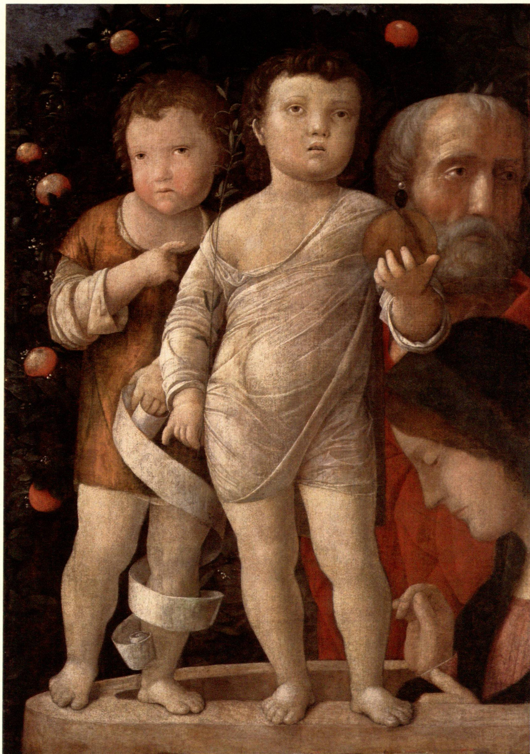
Abb. 5 Andrea Mantegna »Heilige Familie mit dem Johannesknaben« um 1495/97, London, National Gallery