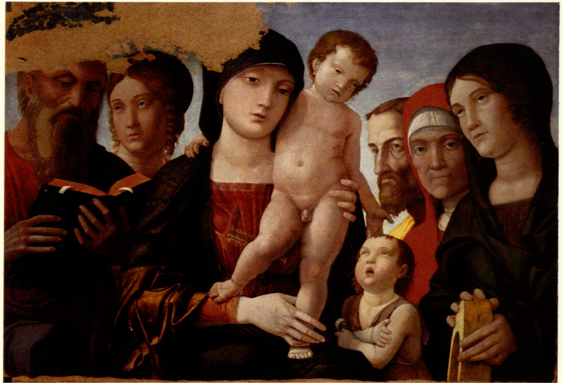
Abb. 3 Andrea Mantegna »Madonna mit Kind und Heiligen« Turin, Galleria Sabauda

der Bildfindung für seine Gemälde dienten, sondern auch potentiellen Auftraggebern als eine Art Musterkatalog vorgelegt werden konnten. Dass andererseits das mögliche Spektrum an Formen von Madonnen-Bildern selbst mit dieser Sammlung immer noch keineswegs ausgeschöpft war, lässt schon ein Vergleichsblick auf die kleine Bildauswahl dieser Ausstellung erkennen.