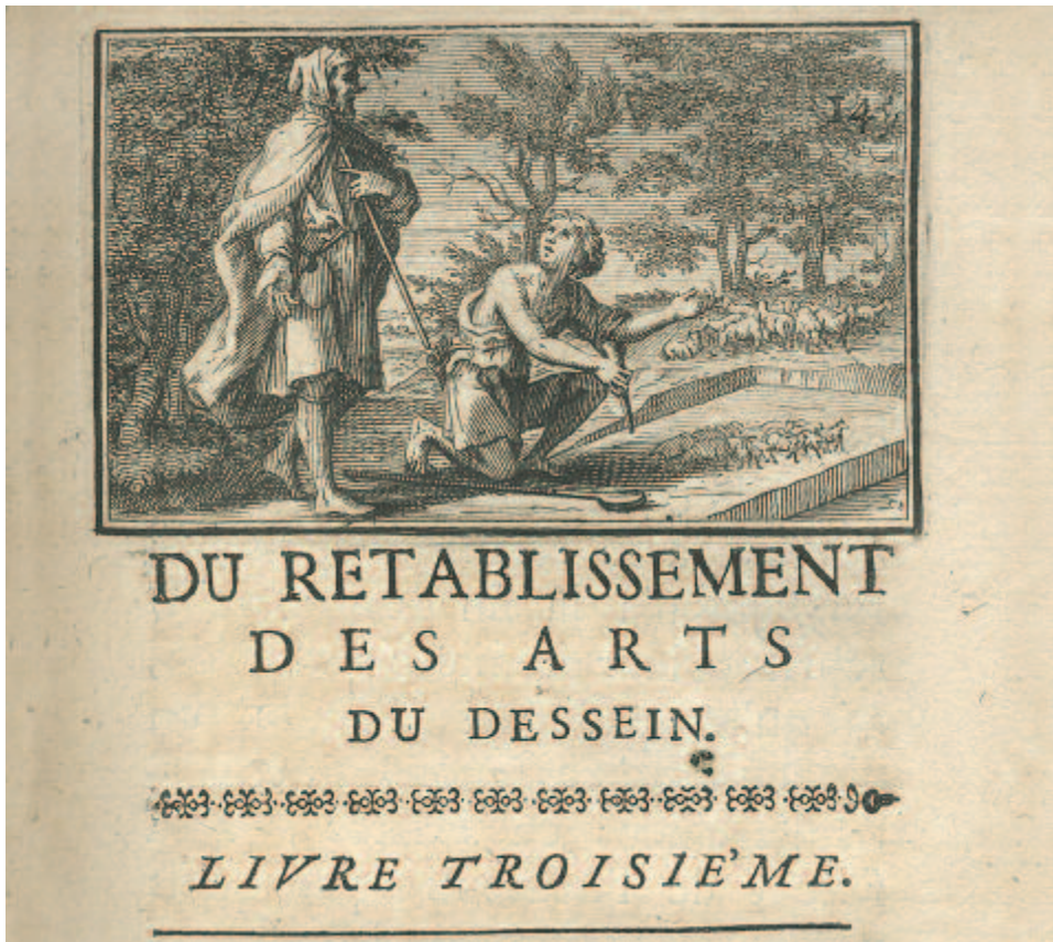
Tafel 2: Cimabue entdeckt Giottos Talent (Monier 1698, S. 145)