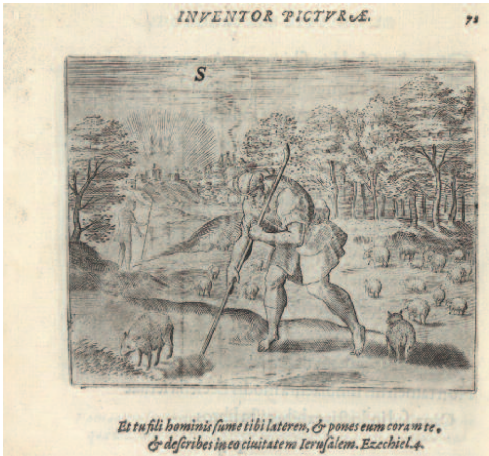
Abb. 1: G. de Jode, Die Entdeckung der Malkunst (Jode/Haecht 1609 [1579], S. 72)

eröffnet werden sollte. Nach seiner Rückkehr wurde er 1674 Mitglied der Pariser Académie Royale und hielt dort seit 1674 Vorträge, seit 1686 als Professor. Seine Vorlesungen zu Themen wie „l'origine et le progrès“, „le déclin et la chute“ und „[l]a renaissance et le rétablissement des arts du dessein“ stellte er zu dem im August 1698 publizierten Buch zusammen. Dem „vice-Protecteur“ der Akademie seit 1691, Édouard Colbert, Marquis de Villacerf, ist es dediziert. Bevor Monier den zweiten Band seiner Geschichte der Künste publizieren konnte, der das 17. Jahrhundert behandeln sollte, starb er im Jahr 1703.