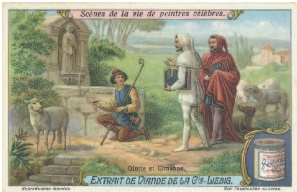
Abb. 2: Cimabue entdeckt Giotto's Talent (Liebig-Sammelbild 1923)

gangs mit der Spätantike und ihr Wiedererwachen und -erstarken ausgehend von der Toskana seit der dortigen Protorenaissance des 11. Jahrhunderts, in der Malerei dann vor allem seit den Jahrzehnten um 1300 behandeln. Monier verwendet für die Anfangsphase der neuzeitlichen Bildkünste und Architektur explizit den Begriff „renaissance“ – in seinem Akademie-Vortrag schon im Titel, im dritten Kapitel seines Buches zumindest im Text. Dabei bezeichnet „renaissance“ für ihn die Phase des ‚Wiedererwachens‘, während die sich anschließende Zeit der Etablierung dieser neuen Kunstformen davon als „retablissement“ unterschieden wird.